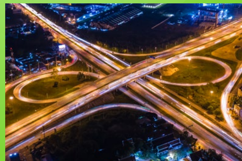
In unmittelbarer Nähe zu den Autobahnen A7 und A37