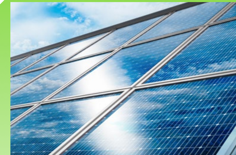
Hochspezifisches, energieeffizientes Gebäudedesign