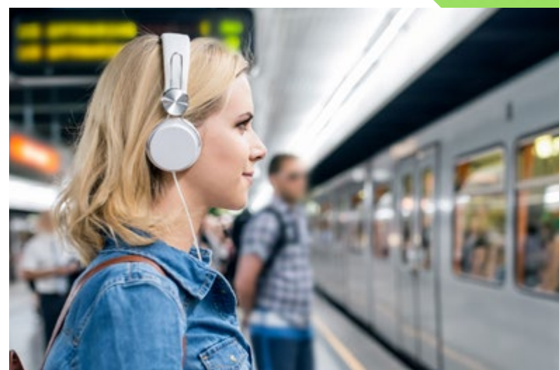
Hervorragend ans Stadtzentrum angebunden – Grundstück grenzt an Stadtbahnhaltestelle, weniger als 5 Gehminuten zur Linie 6