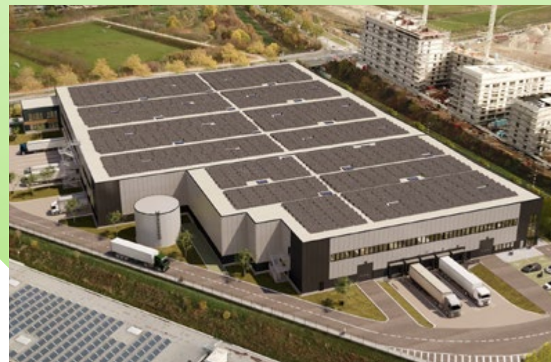
Aufgeteilt in zwei attraktive Units