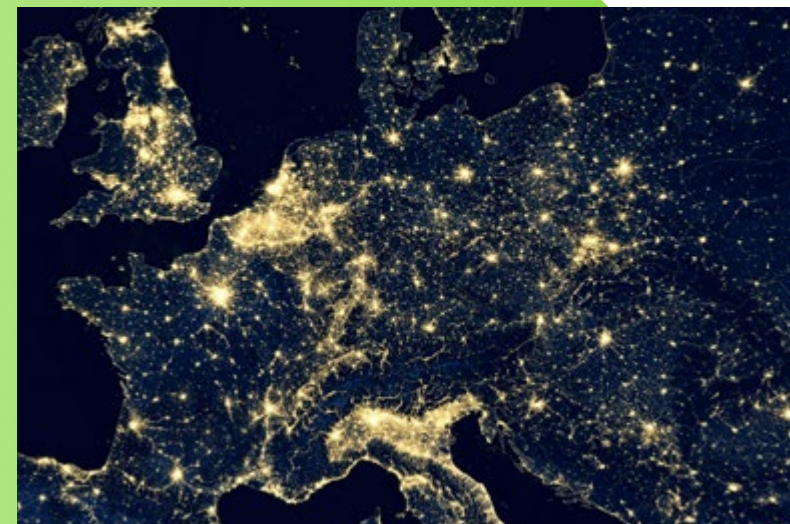
Im Herzen Europas